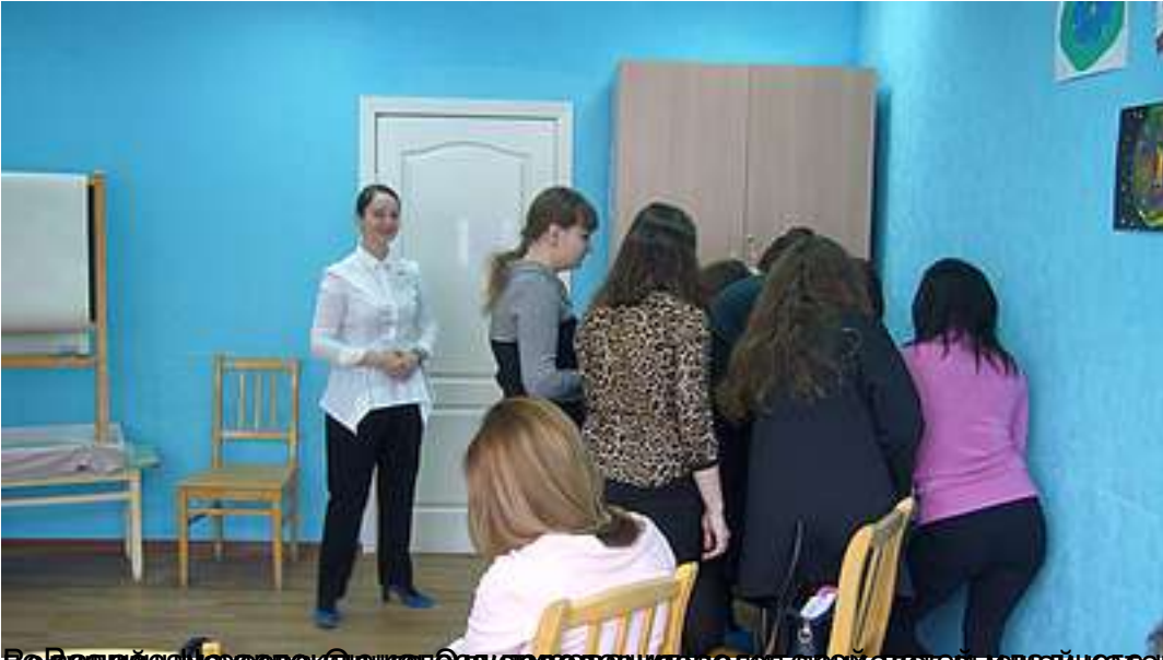
Во время мастерской женщины обсуждают вопросы воспитания детей старшего дошкольного возраста